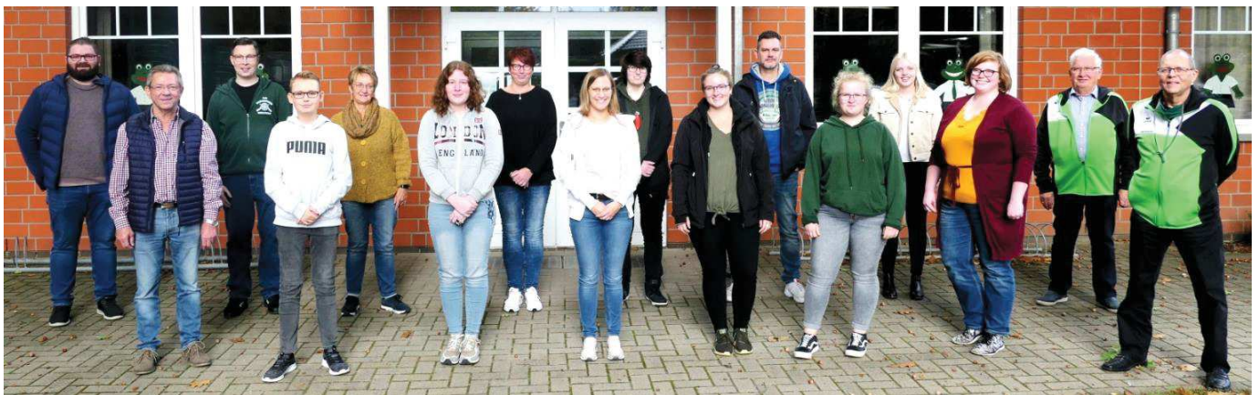
Abschlußfoto Waffensachkunde 2020 mit Verantwortlichen u. erfolgreichen Teilnehmern