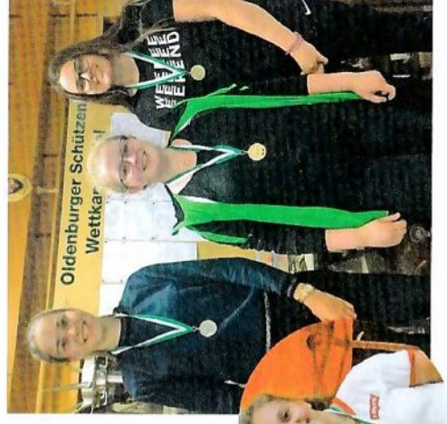
Oldenburger Schützen Wettkar

Text und Foto: Marianne Vallan (Bezirkspressewartin)