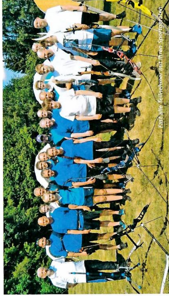
Fast alle Teilnehmer mit ihren Sportgeräten

Text: Marianne Vallan (Bezirkspressewartin)