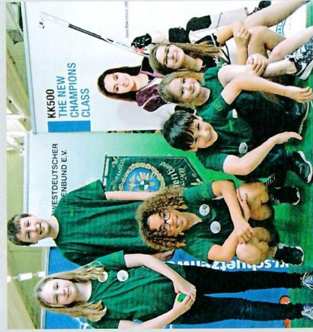
Die Rehdener Lichtpunktschützen räumten die meisten Medaillen ab

Text und Foto: Marianne Vallan (Bezirkspressewartin)